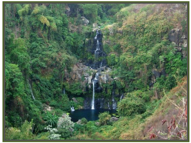
Bassin des Aigrettes depuis le canal Bruniquel