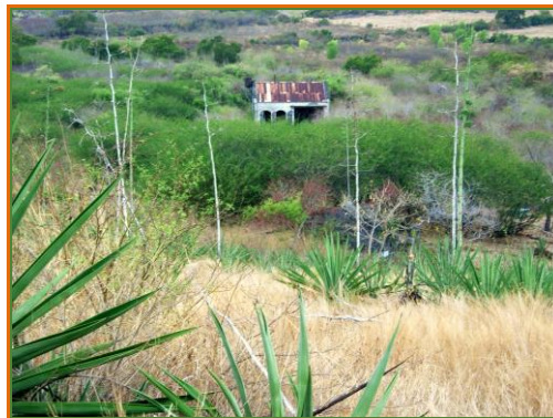
Un des 12 moulins Kader qui existaient sur l'île Fabrication de corde (1850 à 1950)