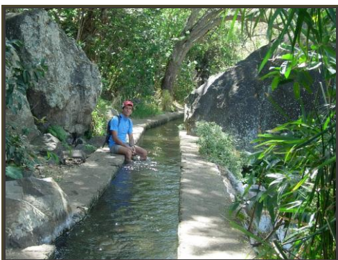
Canal Prune Ravine St. Gilles