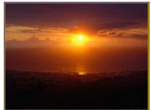
Fin de journée depuis le Golf