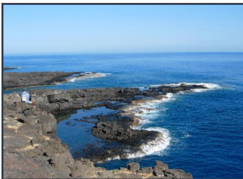
Pointe Barre à Mine