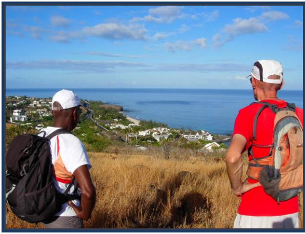
Boucan Canot depuis le Cap Champagne