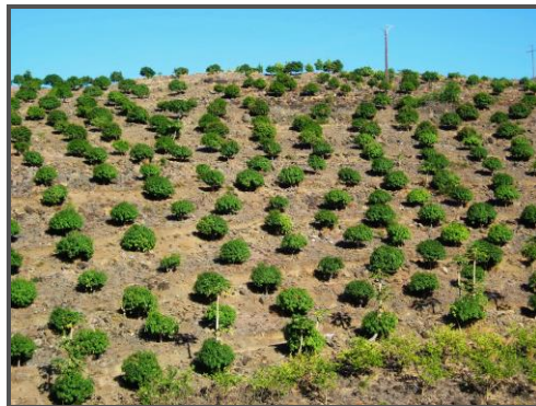
Plantation de manguiers