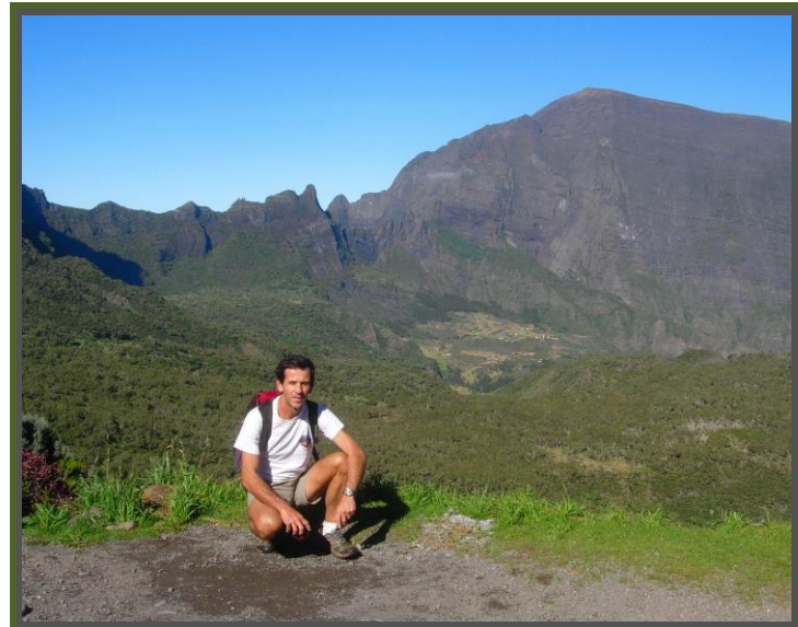
Au loin le Col du Taibit et le Grand Bénère

Pour finir en beauté 2012, quoi de plus logique que de cheminer dans les 3 Cirques qui font la renommée géographique et historique de l'Ile de la Réunion. Cet itinéraire est magnifique, il est à la portée de tous, pas de difficulté majeure !