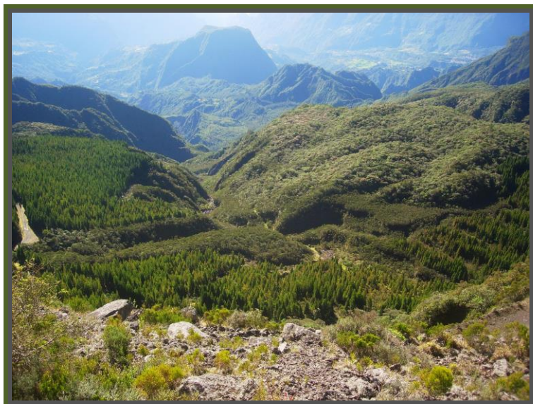
Plaine des Merles dans le cirque de Salazie