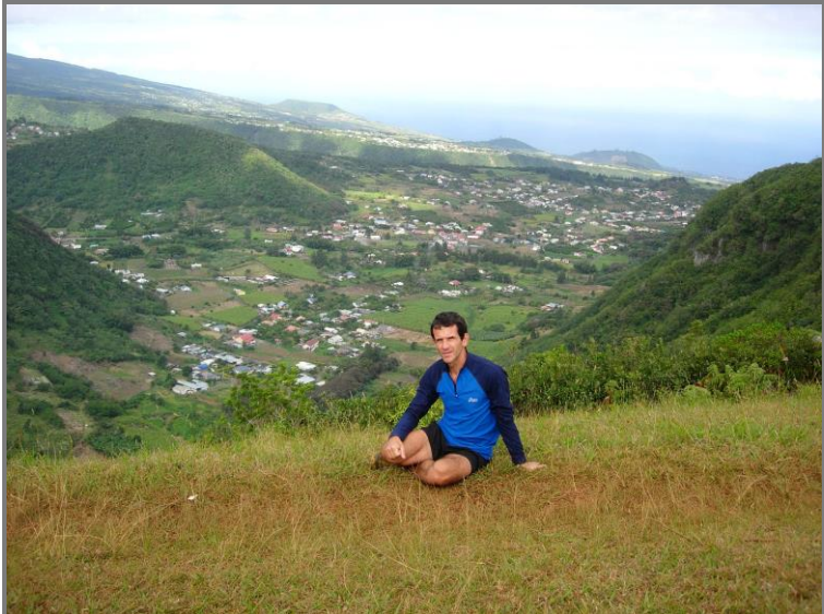
Panorama sur la Plaine des Grègues et le Sud Sauvage