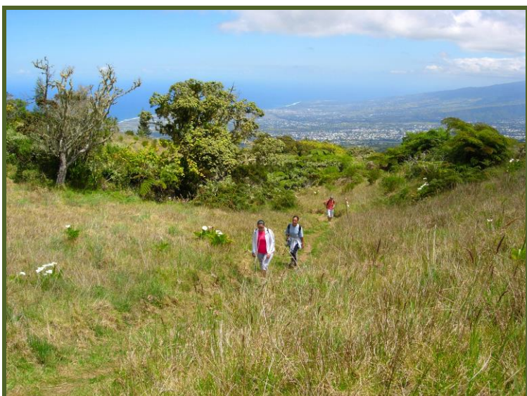
Prairie au lieu dit « La Mare » non loin de Notre-Dame de la Paix