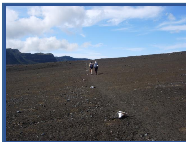
Plaine des Sables

Renseignements et inscriptions : contacter Arnaud Fontana