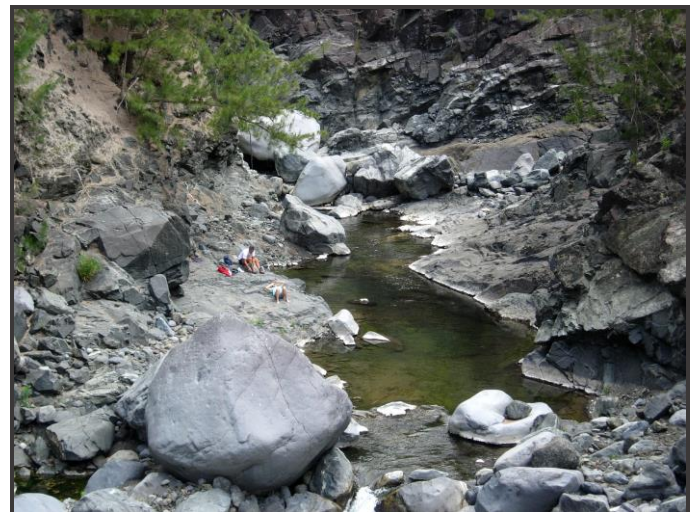
Rivière Du Mat depuis la Passerelle