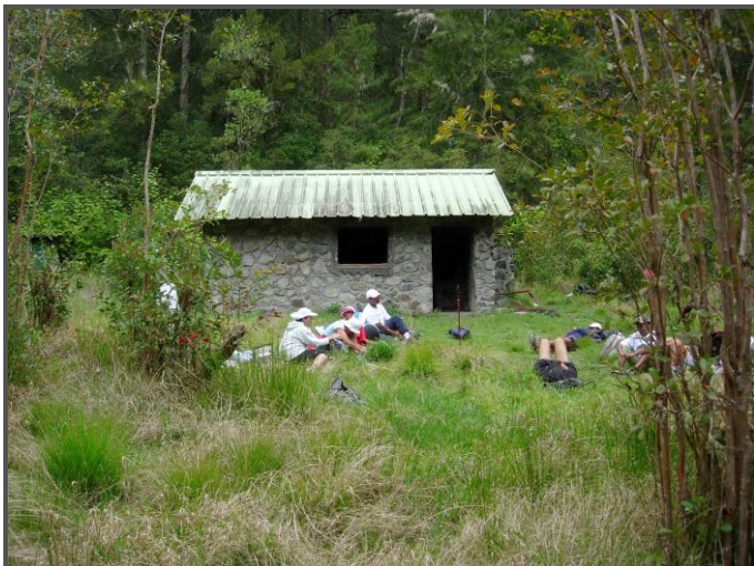
Piquenique Abri Le Grand Sable