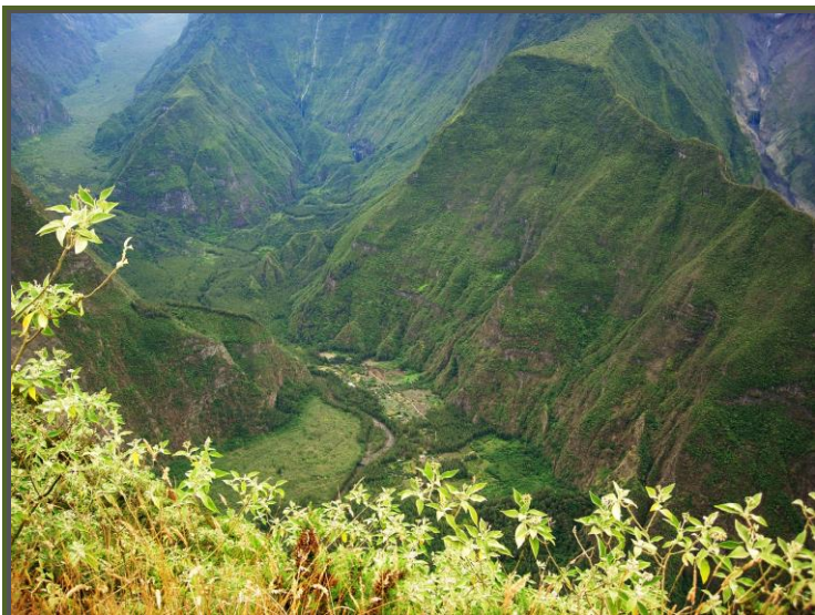
Ilet de Roche Plate – Rivière des Remparts

Itinéraire très varié entre pâturage , forêt de bois de couleur et prairie d'altitude. Depuis Montvert les Hauts , exceptés quelques passages de ravines ,on ne fait que monter pour aboutir au rempart qui surplombe la Rivière des Remparts. Un instant on parcourt le sentier botanique de Notre Dame de la Paix pour finalement arriver au belvédère d'où l'on peut admirer un superbe panorama sur le site de la Rivière des remparts.