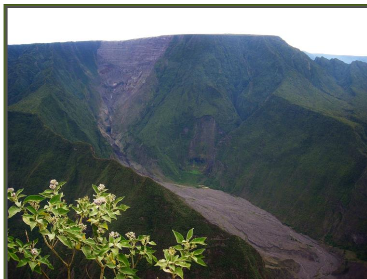
Cassé et Bras de Mahavel – Eboulement de 1965

Renseignements et inscriptions : contacter Arnaud Fontana au 02.62.71.90.15 ou 06.92.35.55.44