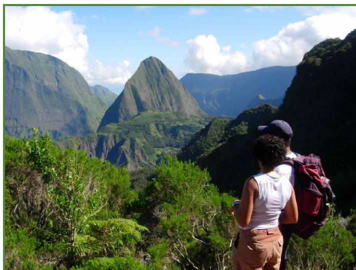
Cirque de Mafate Piton Cabris (1447m)