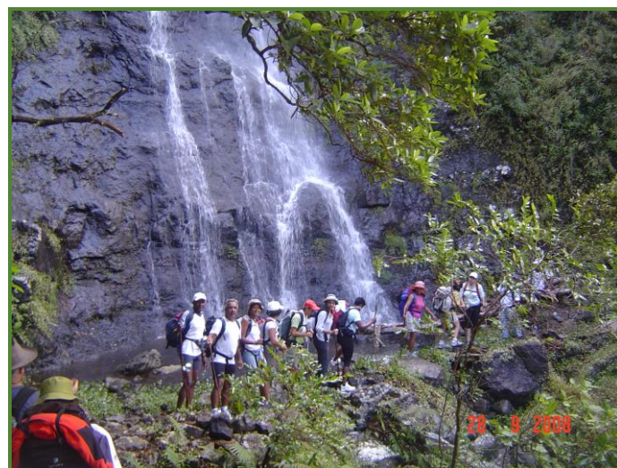
Cascade sur le sentier Augustave

Le sentier Augustave que nous avons déjà parcouru dans le sens de la montée est accroché au flanc abrupt de la crête de la Marianne, il suit en partie la canalisation construite en 1978. Bénéficiant du débordement du climat humide de la région au vent, le bras Bémale que nous allons descendre cette fois-ci depuis la ravine Savon a une végétation exubérante et contraste avec le reste du cirque.