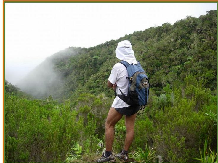
moment de méditation au regard d'une végétation dense

Renseignements et inscriptions : contacter Arnaud Fontana au 02.62.71.90.15 ou 06.92.35.55.44