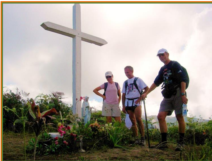
Piton de l'Entre Deux