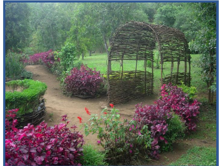
Air de Repos

Renseignements et inscriptions : contacter Arnaud Fontana au 02.62.71.90.15 ou 06.92.35.55.44