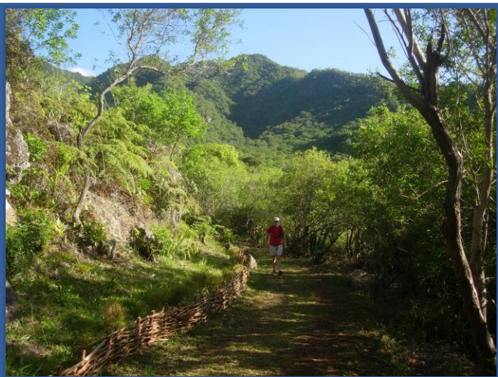
Chaîne du Bois de Nêfles