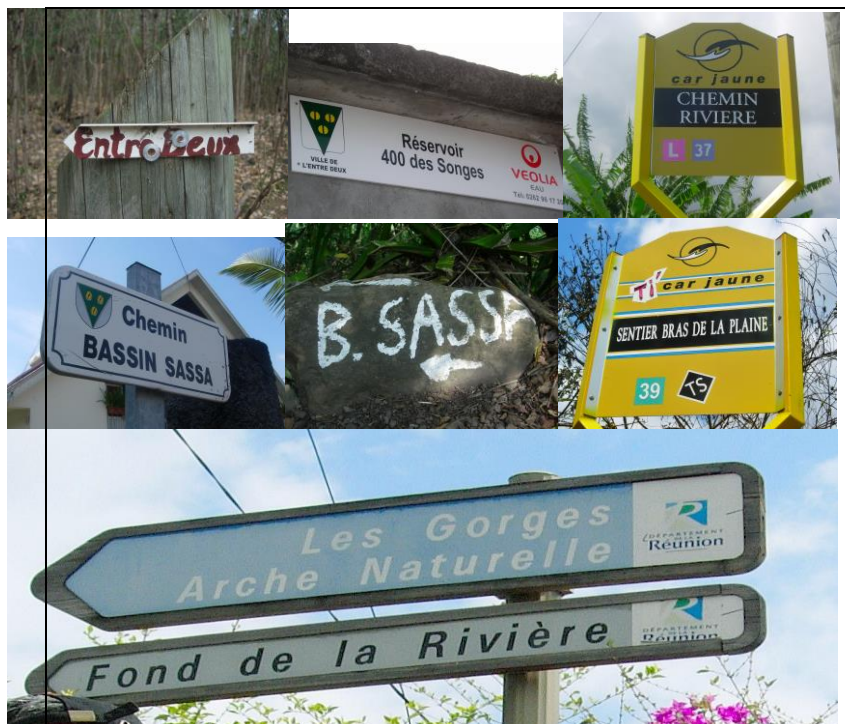
Carte IGN 4405 RT St. Pierre

Lieu de Rendez-vous : - 7h au parking de la piscine de St. Paul Front de mer