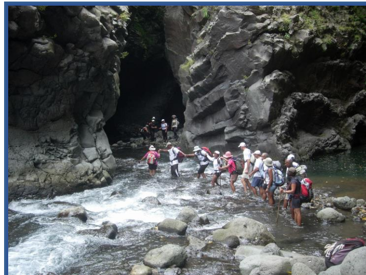
Les pieds dans l'eau dans les Gorges