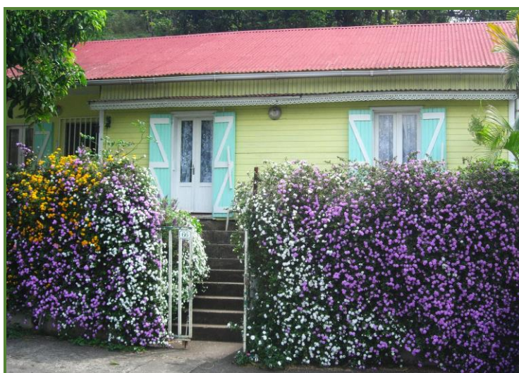
De Case en Case