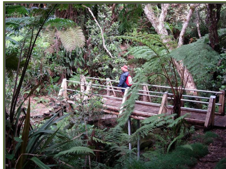
Foret de Bélouve

Renseignements et inscriptions : contacter Arnaud Fontana Fixe :02.62.71.90.15 / GSM : 06.92.35.55.44