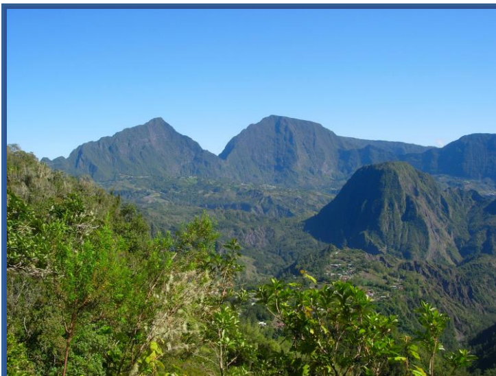
Panorama depuis le belvédère du gîte