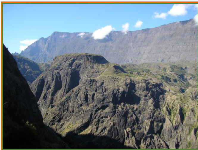
Roche Plate et le Grand Bénare depuis Gd Place