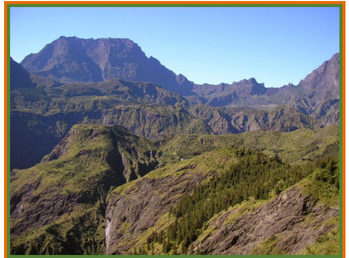
Roche Plate et le Gros Morne depuis le Ti Col

Ce nouvel itinéraire qui nous permet d'arpenter de nouveau les sentiers du majestueux cirque de Mafate est le 9 em . depuis 2004. Pour vous dire qu'on n'a jamais fini d'en découvrir les splendeurs.