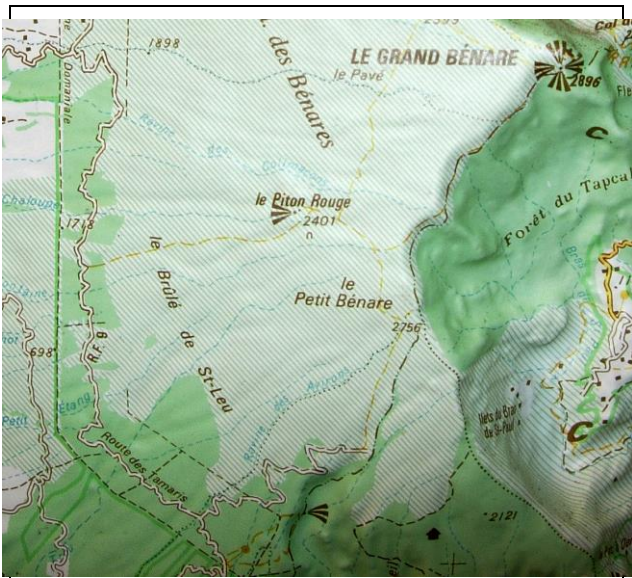
Carte IGN 4404 RT St. Denis