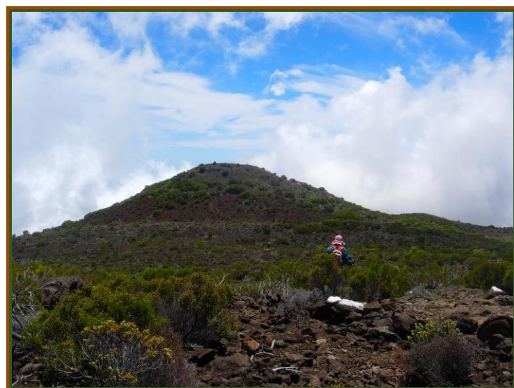
Piton Rouge 2401m

Renseignements et inscriptions : contacter Arnaud Fontana au Fixe :02.62.71.90.15 / GSM : 06.92.35.55.44